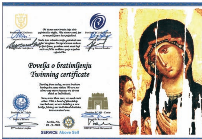
Дана 4. октобра 2008., РК Ниш-Центар, РК Крушевац из Србије, као и РК Софија-Балкан из Бугарске и РК Трикала из Грчке, потписују повељу о узајамном братимљењу