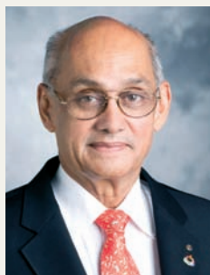
В Интернет Речи и новини от президента на РИ Калян Банерджи на www.rotary.org/president