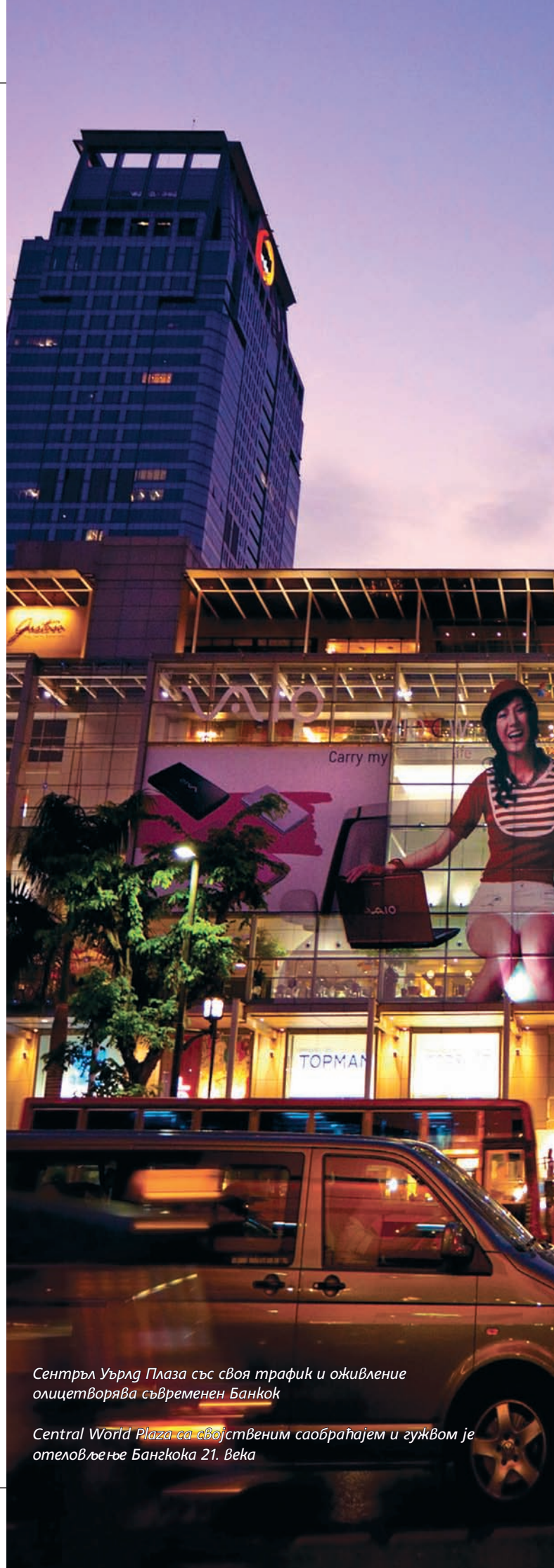
Сентръл Уърлд Плаза със своя трафик и оживление олицетворява съвременен Банкок

С появата на автомобилите през двадесети век архитектите започват да запълват каналите на града и да прокарват улици. Притокут на американски войници по време на войната във Виетнам води до развитие на туризма, а инвестиционният бум през 1980-те и 1990-те години привлича стотици многонационални компании и превръща Банкок в център на финансите, културата, модата и заба-